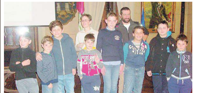
Le giovani leve dell'alpinismo cadorino