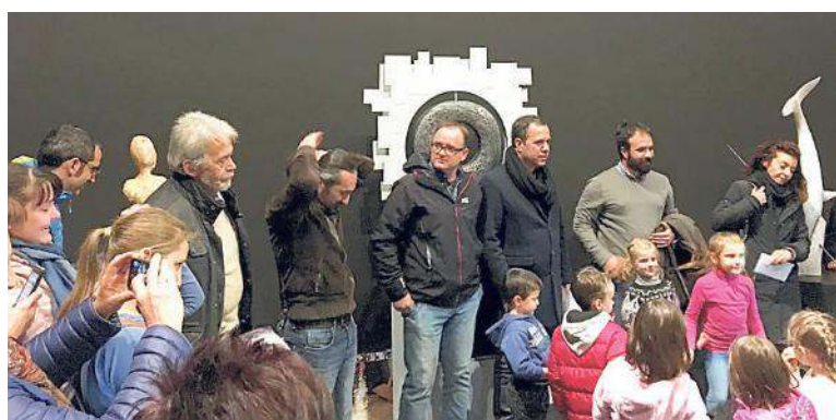
La consegna del premio alla scuola di Cusighe